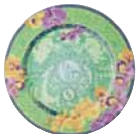
2004 Floralia DV