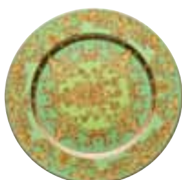
2003 Floralia Green