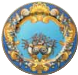
1995 Les Trésors de la Mer