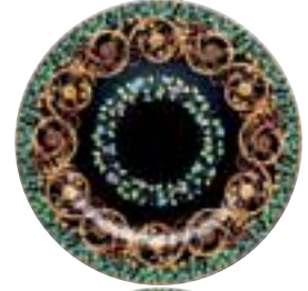
1997 Gold Ivy