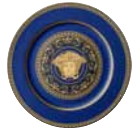
2001 Medusa blue