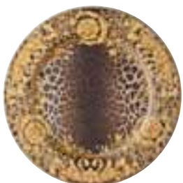
2002 Wild Floralia