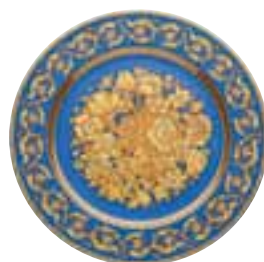
2000 Floralia blue