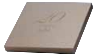
Verpackung für 20 Years Plate Collection