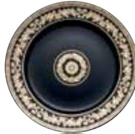
1996 Gold Baroque