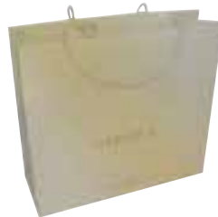
Tragetasche für 20th Anniversary Celebration Highlight Collection