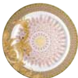
2010 Les Rêves Byzantins