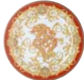
2012 Asian Dream