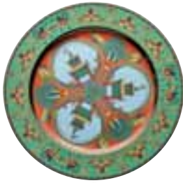
1993 Marco Polo