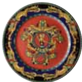
1993 Le Roi Soleil