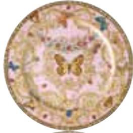
1996 Le Jardin de Versace