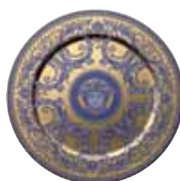
2011 Le Grand Divertissement